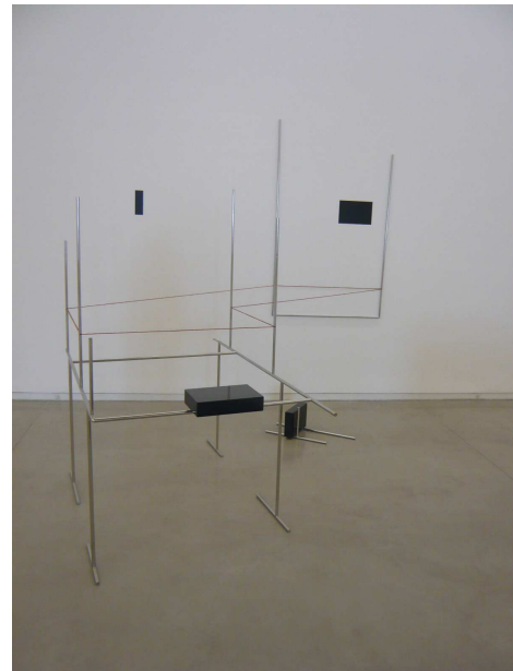
Lá dentro , 2010 Acero inoxidable, granito y lana

La transparencia y ligereza están presentes en su obra. El propio artista declara "Me gusta que los objetos se dejen atravesar por la mirada, la transparencia provoca que la mirada vuelva a tí. Mis trabajos necesitan ser re-vistos, la primera vez la mirada los atraviesa y retorna y es esa segunda vez cuando la mirada los hace suyos" 2 .