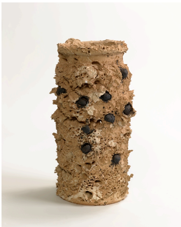
Urna prebarceloniana, 2012

En 2003 recibió el premio Príncipe de Asturias de las Artes y en 2008 inauguró la cúpula de la Sala XX del Palacio de las Naciones Unidas en Ginebra. Recientemente ha sido reconocido con el Premio Penagos de Dibujo 2011 e investido doctor honoris causa por la Universitat Pompeu Fabra de Barcelona.