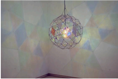
Before the star lamp, 2009-2010

En todas las obras de la exposición se pueden ver elementos fundamentales en la producción del artista, como su interés por la óptica, (los trabajos de Kepler en este campo son fundamentales ya que creó el telescopio refractor) los juegos de reflejos a través de espejos, los reflejos de cristales coloreados en la pared, como imágenes de un caleidoscopio, las sombras, el efecto de los colores en la retina del espectador, la luz .