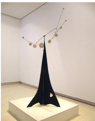
Model for Rosenhof, 1953

Desde mediados de los años 30, Calder desarrolla grandes encargos para el exterior. Algunos de sus primeros encargos importantes son la Fuente de Mercurio para el Pabellón español en la Exposición Universal de París en el año 1937 y el mobile Lobster Trap y Fish Tail que son expuestos en el MoMa de Nueva York.