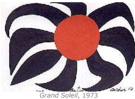
Grand Soleil, 1973

En 1937 realiza la exposición "Stables and Mobiles" en la galería de Pierre Matisse. Calder define el nuevo concepto de arte en movimiento: "¿Por qué tiene que ser estático el arte? Lo que usted contempla es una abstracción, esculpida o pintada, una combinación sumamente apasionante de planos, esferas, núcleos, sin el menor significado. Puede que sea perfecta, pero permanece siempre inmóvil. El siguiente paso en la escultura es el movimiento".